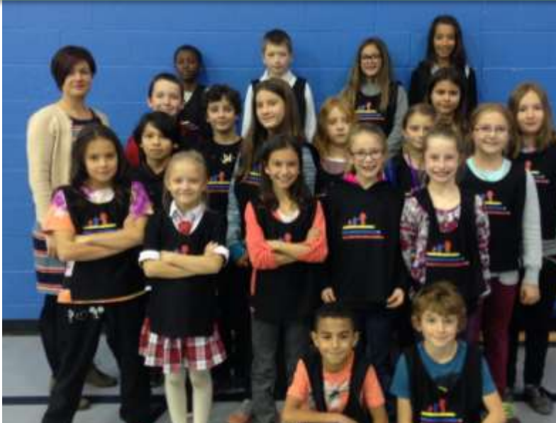
Conseil étudiant 2016-2017