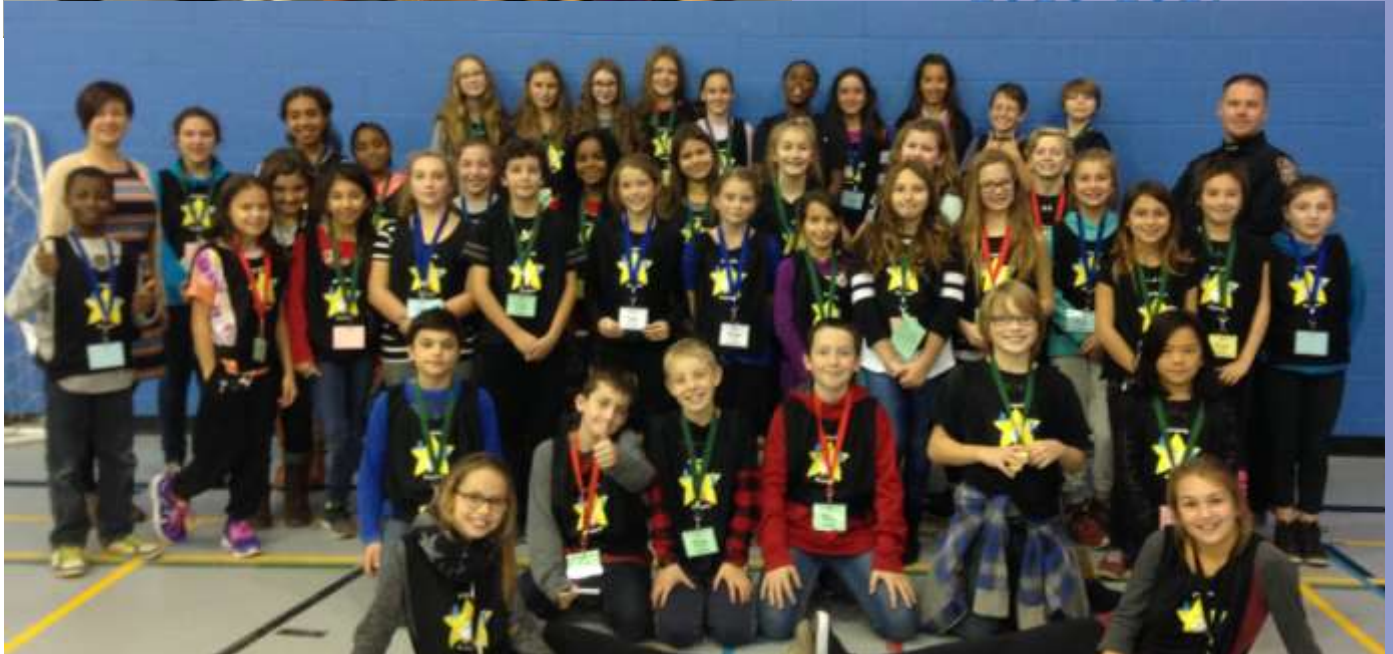
Brigade scolaire 2016-2017